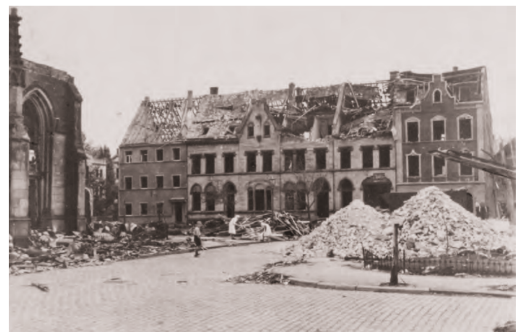
Bei Luftangriffen in den Jahren 1942 und 1944 wurde der nördliche Teil des Rheinlandhauses zerstört.