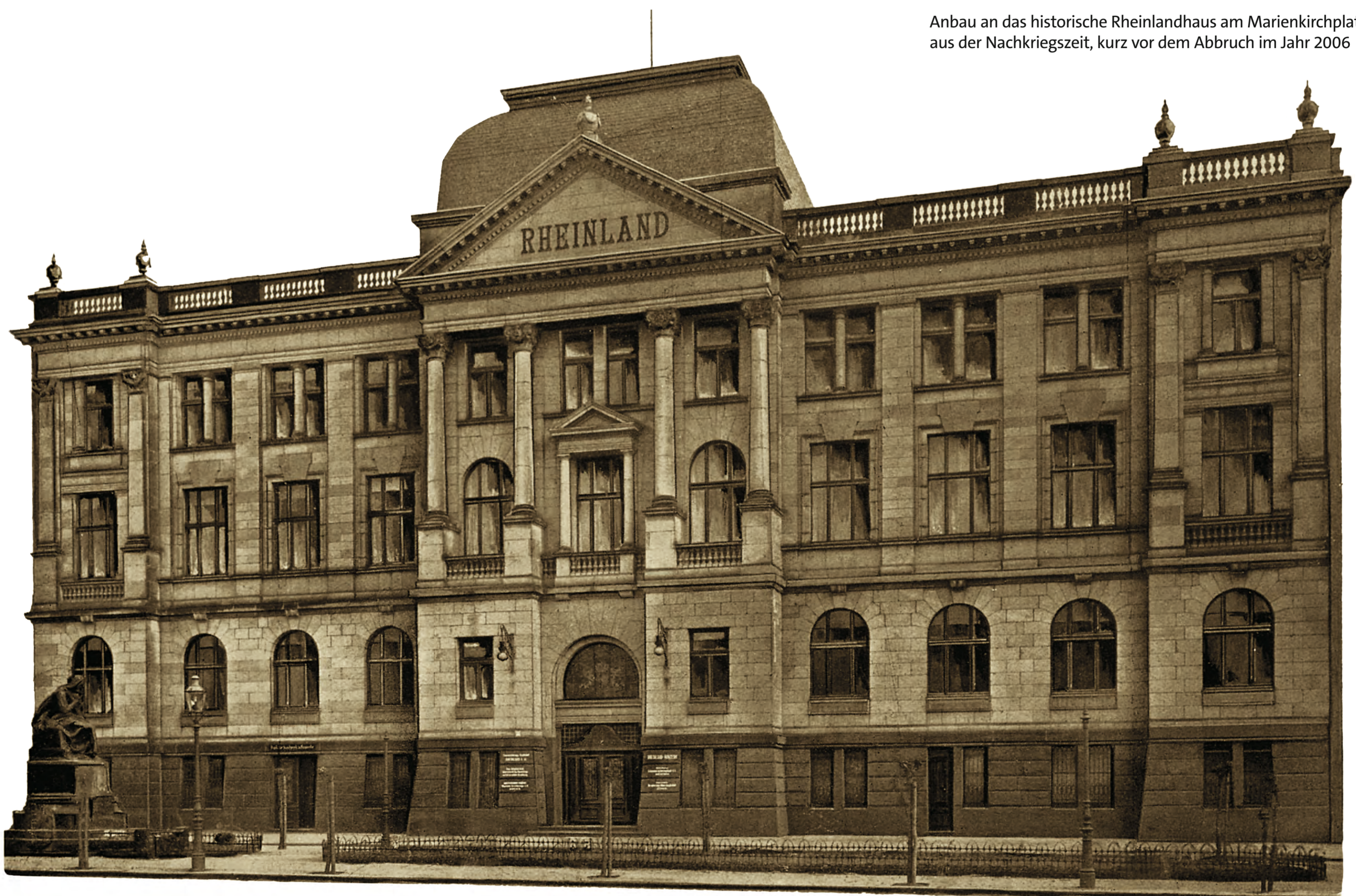
Das 1906 errichtete „Rheinlandhaus“, Verwaltungsgebäude der Feuerversicherungs-Gesellschaft Rheinland A.G. mit dem vom Bildhauer Josef Hammerschmidt geschaffenen Brunnen „Marienborn“ (li.), 1906