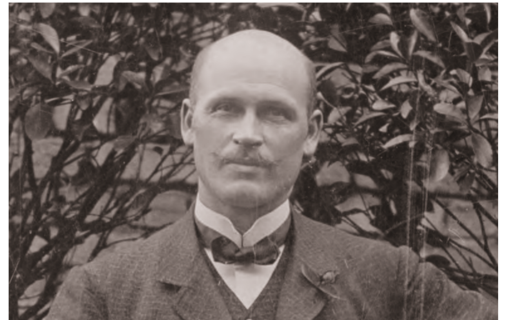
Der Neusser Architekt Carl Schaumburg (1867–1940) realisierte den Bau des Rheinlandhauses in nur 9 Monaten.