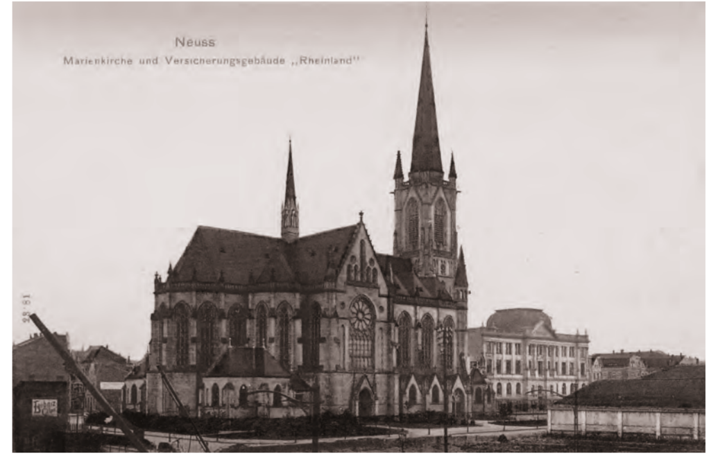
Die 1902 fertiggestellte Marienkirche auf dem Gelände des ehemaligen katholischen Friedhofs, im Hintergrund das Rheinlandhaus, um 1910