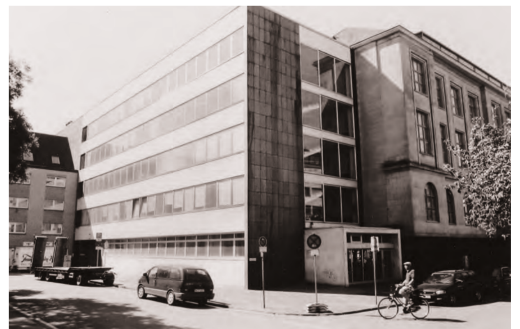
Anbau an das historische Rheinlandhaus am Marienkirchplatz aus der Nachkriegszeit, kurz vor dem Abbruch im Jahr 2006