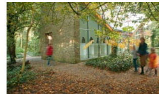
01_Museum Insel Hombroich

Neuss hat Lebensqualität. Die Stadt am Rhein bietet einfach viel. Viel Natur, mit ihren beschaulichen Rheinauen und der nieder-rheinischen Landschaft ringsum, die zu Ausflügen und zum Durchatmen einlädt. Viel Sport, in ihren hunderten von Breiten- und Leistungssportvereinen, auf ihren Golfplätzen oder der ersten Skihalle Deutschlands, in der das ganze Jahr über perfekte Skibedingungen herrschen. Aber auch viel Kultur. In Neuss befinden sich Museen und Theater von überregionaler Bedeutung. So lockt das internationale Shakespeare Festival jedes Jahr Zuschauer und Ensembles aus aller Welt in den Original-Nachbau des historischen Globe-Theaters auf das Rennbahngelände. Und hier findet alljährlich auch das größte Bürger Schützenfest Deutschlands mit farbenprächtigen Umzügen und großer Festwiese statt. Aber auch wer die Ruhe schätzt wird Neuss lieben. Attraktiver Wohnraum, sowohl in den neuen Wohngebieten im Grünen, wie auch in den historischen Stadtvierteln, ist in den letzten Jahren neu entstanden. Die eigene Wohnungsbaugesellschaft der Stadt sorgt hier für bedarfsgerechte, hochwertige Angebote. Eine vielfältige Gastronomieszene rundet das Angebot dieser freundlichen Stadt am Rhein ab. Und natürlich – ein typisch Neusser Vorteil – ist alles schnell erreicht.