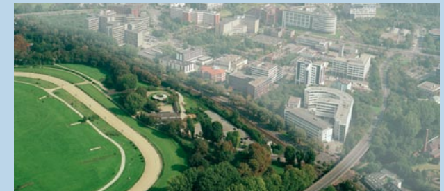
Am südöstlichen Rand der Rennbahn entsteht entlang der Stresemannallee ein rund 2,5 Hektar großes Areal für modernes Arbeiten im Grünen.